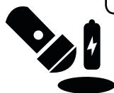
Latarka i baterie