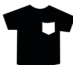
Odzież na zmianę