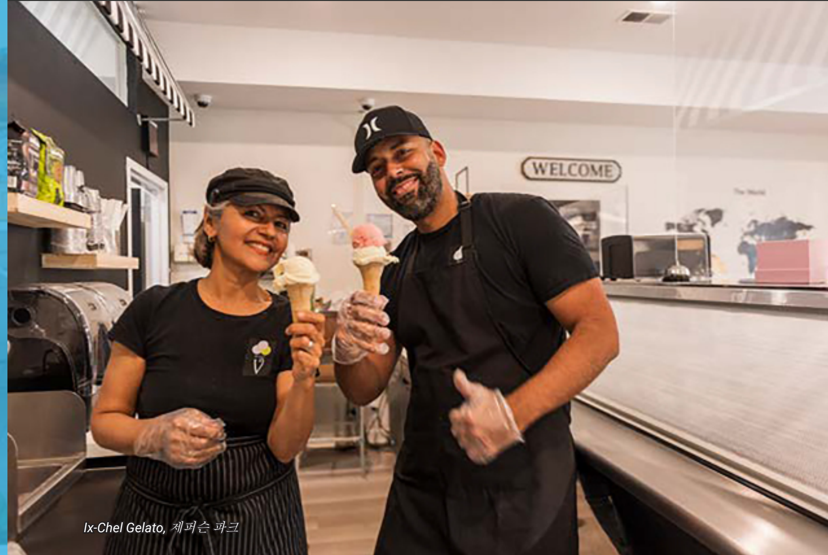
Ix-Chel Gelato, 제퍼슨 파크