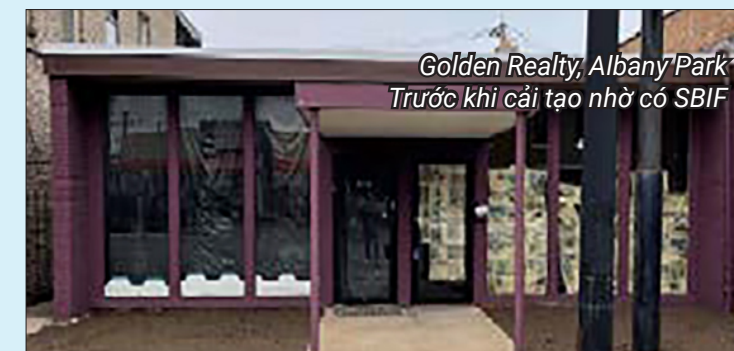
Golden Realty, Albany Park Trước khi cải tạo nhờ có SBIF

Đơn đăng ký và thông tin bổ sung có sẵn tại địa chỉ www.chicago.gov/sbif . Trang này có thể được dịch từ tiếng Anh bằng cách sử dụng menu thả xuống ở góc trên bên phải.