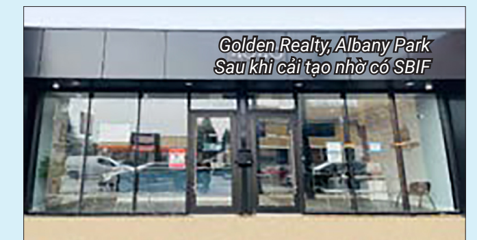
Golden Realty, Albany Park Sau khi cải tạo nhờ có SBIF