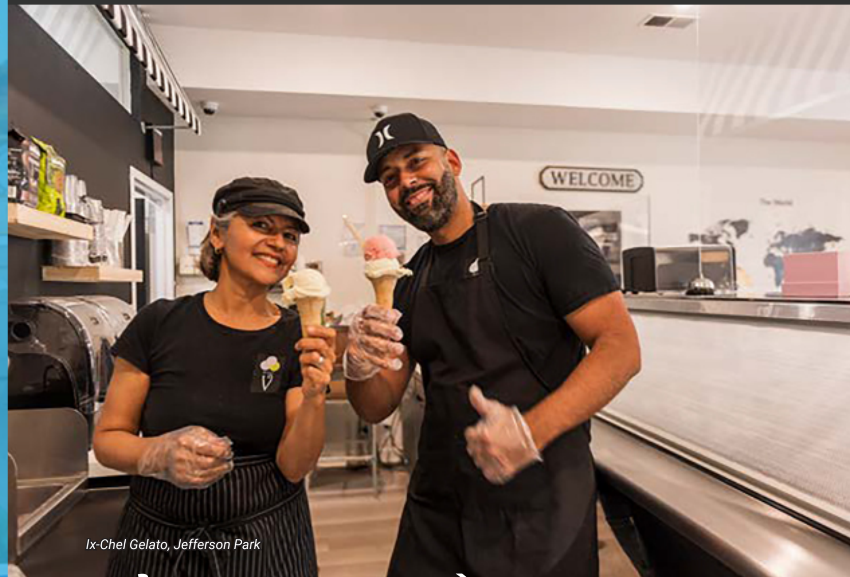
Ix-Chel Gelato, Jefferson Park