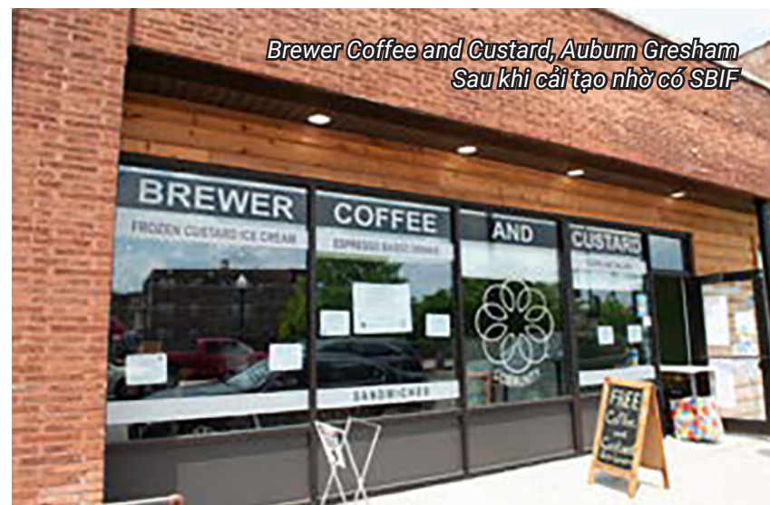
Brewer Coffee and Custard, Auburn Gresham Sau khi cải tạo nhờ có SBIF